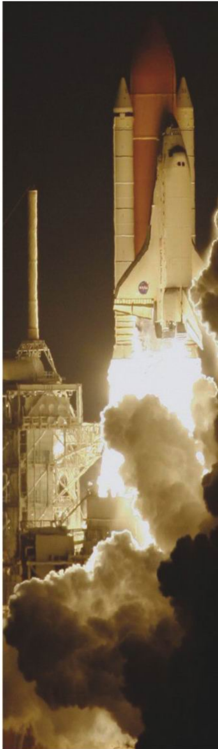
美国国家航空航天局：“发现号”发射

Mini-Circuits是频综设计领域的领导者，其多款频综被应用于全球许多大的项目。Mini-Circuits已经设计了250多款频综，其中的大多数是通过和客户面对面的交流被设计出来的。