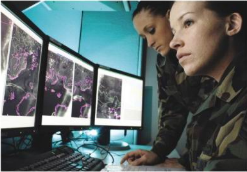
地面卫星通信中心