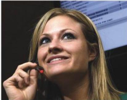
美国海军照片：WiMax（全球微波互联接入）技术