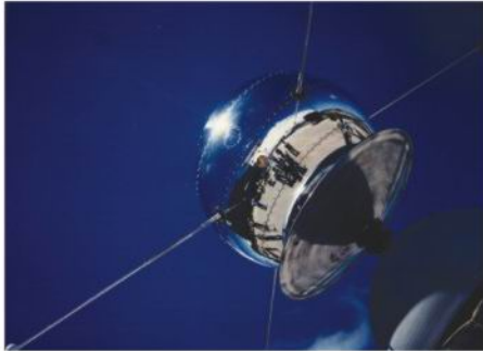
美国国家航空航天局：先锋雷达导弹卫星