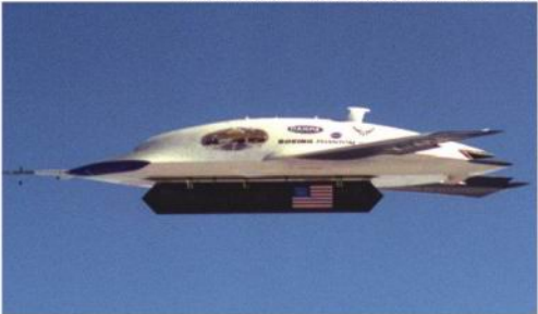
X-45A无人战斗机